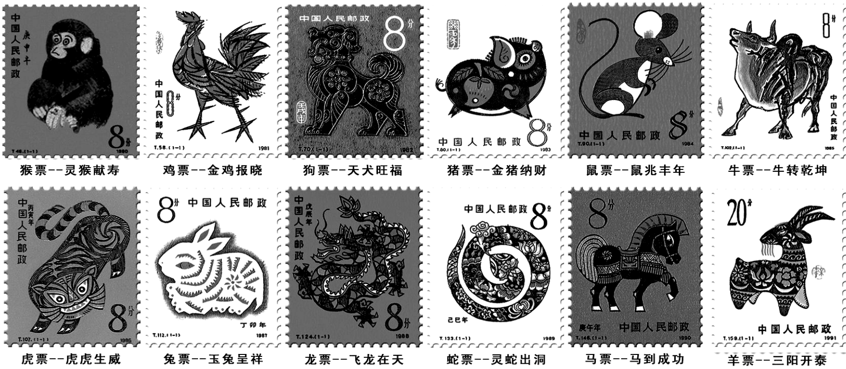
▲2011年新年临近，中国集邮总公司，破例将首轮十二生肖邮票铸造成12枚“国瓷生肖邮票”，以12个生肖的12个寓意祝福玉兔呈祥年，岁岁平安、人人幸福。

打破30年来国家只发行单枚纸质生肖邮票的惯例，破例发行世界第一套《国瓷十二生肖邮票》，公认为2011年权威高端的“生肖贺岁钱”。