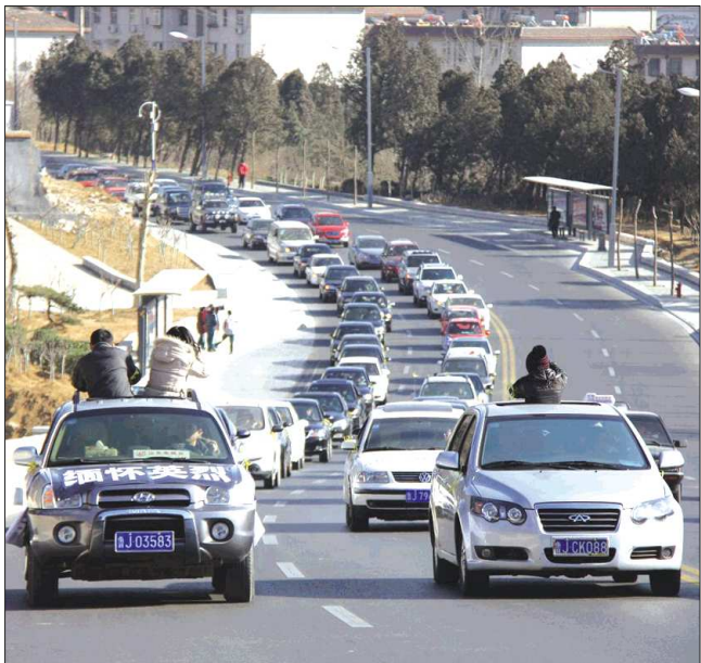
70多辆车组成的悼念车队行驶在环山路上。

本报泰安1月6日讯(记者 李虎 胡修文) 6日中午,“越野e族”等多个车友俱乐部的车友自发组成悼念车队,集体前往事发地点向殉职英雄敬献花篮,鸣笛寄托哀思。 中午12点10分左右,山东科技大学校门附近,参加悼念活动的车友集结,很多车友的车身上都贴有“向英雄致敬”“英雄一路走好”等条幅,还有车友事先准备了一批黄丝带,发放给其他车友。 12点40分左右,由70多辆车组成的悼念车队准时从山东科技大学门口出发,经红门路转向环山路,在天外村广场转向龙潭路,最后来到文化路附近的祭拜地点。车队行进途中,各种车辆自觉避让,很多市民驻足观看,还有热心市民加入悼念车队中。