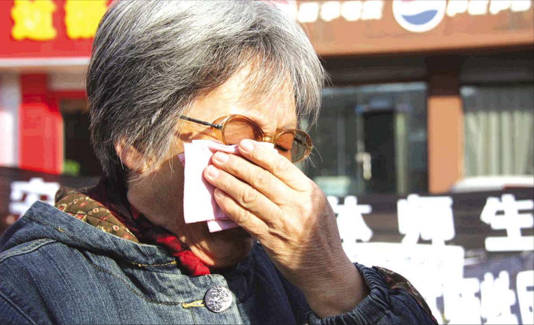
▲悼念现场，一位市民泣不成声。