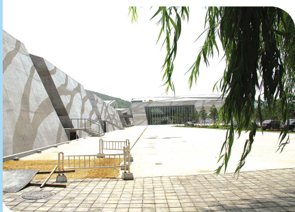
泰山桃花峪游人中心一角。(资料片)

式,积极宣传泰山,推介项目和产品;与中央外宣办、上海东方传媒集团联合拍摄大型外宣节目《冲刺!中国》电视专题片,国际传媒巨头迪士尼公司全球发行,在各国主流媒体播出;继续巩固深化与日本富士山、韩国汉拿山、台湾阿里山、巴西阿拉里皮世界地质公园等友好合作成果,团队游客、入境旅游都实现了新的突破。