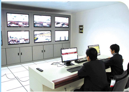
数字泰山工程。(资料片)