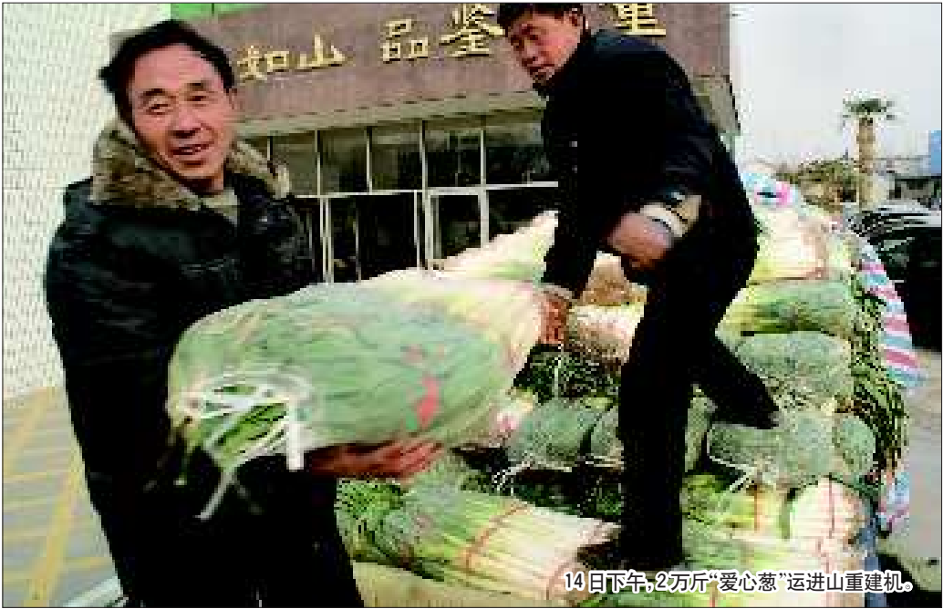
14日下午,2万斤“爱心葱”运进山重建机。

此外,临沂金波源典当行、欧意电器临沂代理等许多爱心企业纷纷加入到爱心行列中,认购费县大葱。