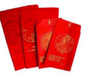
乐呵呵地把这些崭新的连号

钞票递到三个孙辈手中。“钱多少且不论,但是崭新的,给孩子们讨个好兆头。” 而刘厚文一样花心思换新钞的市民不在少数。13日,记者走访了位于添源大街上的四家银行。工作人员介绍说,每年都有特意来取新钞票的市民,一般“换钱潮”是从小年前后开始的,其中以老年人居多,因为新钞是从省行取来的,到来的时间和数额都不一样,有时无法保证每个客户来取时都能满足要求,有一些客户甚至还会提前进行预约。