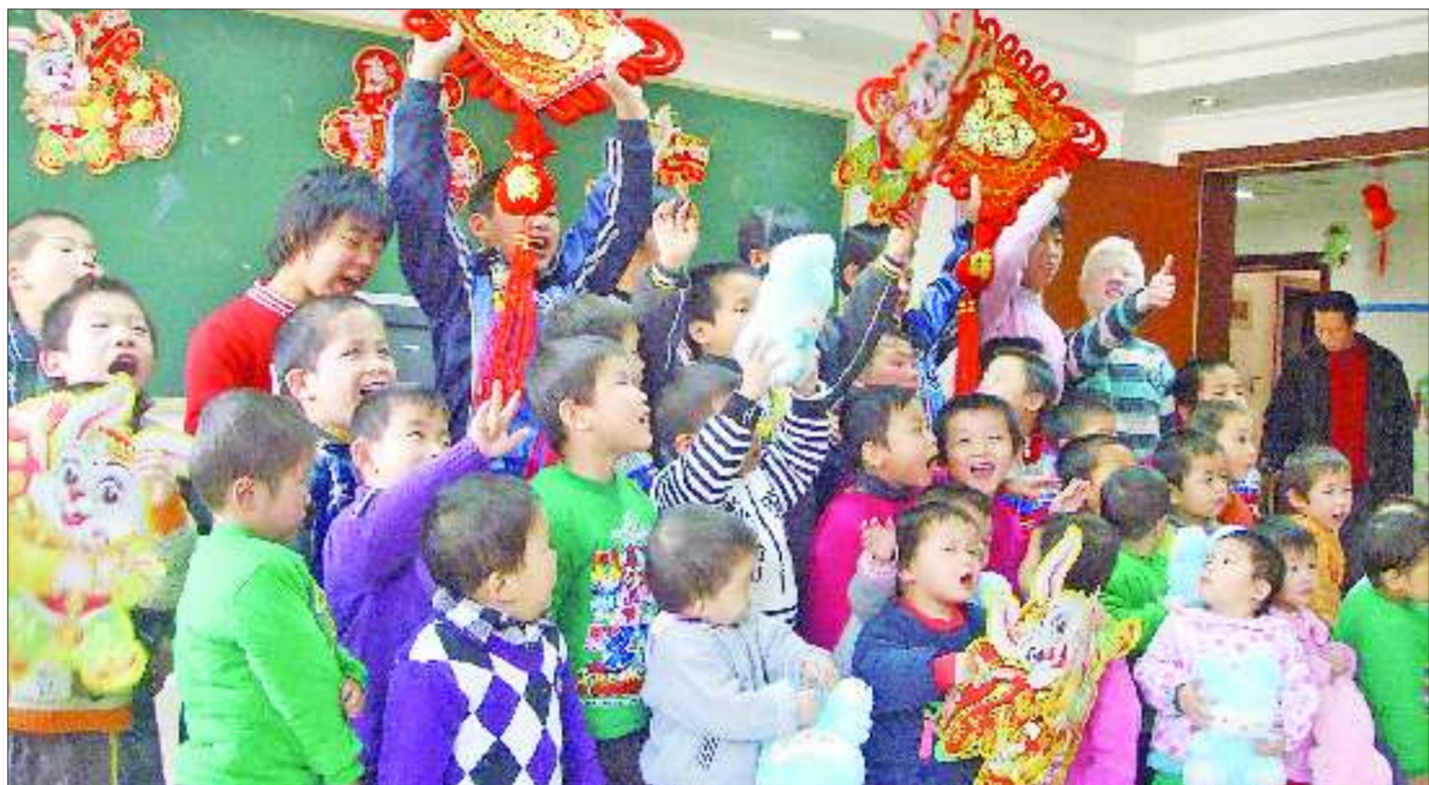
济南市儿童福利院内的50名孩子对新年充满了期望

介绍,市儿童福利院已经连续七年开展了“领孩子回家过年”爱心活动,先后有240名福娃走进市民家中,和普通家庭中的孩子一样得到了“父母”的拥抱和更体贴的照顾,使孤残儿童感受到了在家过年的亲情气氛。 据市儿童福利院工作人员介绍,福利院里的孤残儿童生活环境相对封闭,接触社会较少。福利院会创造各种条件让这些孩子慢慢融入社会,感受到社会和家庭的温暖。 据介绍,本次“领孩子回家过年”活动从1月18日开始报名,2月3日(年初一)上午9时市民可到福利院接孩子,2月8日下午5时须将孩子送回福利院。自18日起,持有市区户口的爱心人士可携带户口本、身份证原件和复印件,到市儿童福利院办公室报名,报名截止日期为1月26日。同时,福利院也开通了爱心报名电话:83150008。 济南市儿童福利院位于经十路22892号,市民可乘坐6路、9路、27路、42路、81路、117路、K56路、K92路、K109路公交车到德兴街站下车,经十路路南即是。