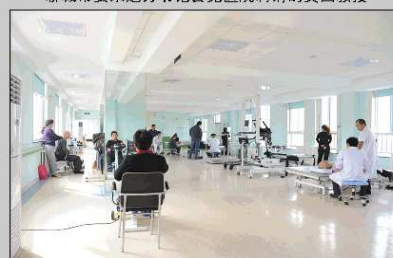
康复理疗多功能大厅