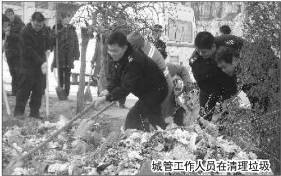
城管工作人员在清理垃圾

本报1月24日讯 (通讯员 李甲 记者 李晖)春节将至,为了让市区苗庄小区居民可以在舒适、干净的环境中度过春节,1月24日,临沂市城市管理局工作人员义务帮助苗庄小区清理生活垃圾。