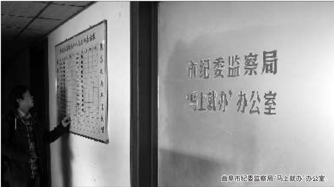
曲阜市纪委监委“马上就办”办公室。

■因为“马上就办”办公室要落实群众要办的事情,都需要各个科室协调完成,所以各个科室也会有紧迫感,也是“马上就办”。