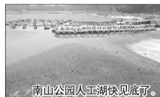
南山公园人工湖快见底了。

南山公园一位工作人员告诉记者,人工湖的湖水一般是雨水积成的,水位很难控制,“水位过高很容易对岸边游玩的游客造成安全隐患。”这位工作人员说,人工湖底有控制湖水水位的供排水阀门,而这些阀门年久失修,有时候并不能起到应有的作用。这次排水其实是为了检修湖底的供排水阀门,并清理