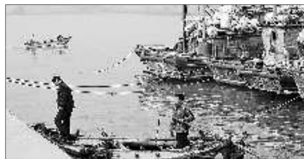
2月24日,秦楼街道大泉沟村的渔民码头上,一层薄雾笼罩着海面,大部分船只没有出海打鱼。

目前,日照海事局通过开展雾季安全监管专项活动,提前拉开了今年雾季安全管理工作序幕。下一步,该局将进一步强化措施,严防雾季各类重特大事故的发生。