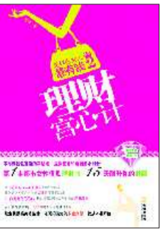
◆书名:《理财富心计》 这样女人最有钱2 ◆作者:高洋 ◆出版社:金城出版社

这时,服务生拿着红酒过来了,并帮叶栎和安妮分别倒上了红酒。这时,安妮拿起自己的杯子,对着叶栎说:“不是说要为我庆祝吗?我和陈总说好了,周一去上班!骗你啦,没想到你这么容易受骗。”叶栎听着安妮的话,笑着摇摇头,这个女人总是能让自己手足无措。 “谢谢你,叶栎!”安妮喝了一小口红酒后,看着叶栎! 叶栎也只是笑着不说话,脸上荡漾着喜悦,跟着呷了一口。 随后,两个人边吃边聊,有关最近的生活、工作,而对彼此的思念,却只字未提。也许,那多日的思念,以香醇的红酒融进体内,等待“更剧烈的爆发”!