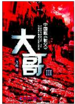
◆书名:大哥Ⅲ ◆作者:唐政 ◆出版社:鹭江出版社

条件是他毕业后必须回到这家企业工作。如果他拒绝的话,到时他将全额退还这部分资助的金钱,并有一定的违约赔偿。这是当时流行的一种腐败方式,很多企业领导人因此解决自己、领导、亲朋好友的读书问题,正式堂皇的名称为“代培”。但是,这样的好事显然不会落到普通人家子弟身上。苏树东毕竟没有太多的社会经验和分析问题的能力,或者,他宁愿相信这是一个美好的童话,他接受了这笔对他非常重要的赞助。高中毕业,他以优异的成绩考上大学,为了照顾奶奶,他选择了较近的省城大学,他的人生,进入一个重要的阶段。 大学首先带给苏树东的不是兴奋和骄傲,而是巨大的挫折。如果仅仅是穿着和言谈,他早有足够的心理准备。但是这一次,打击来自他素以为傲的学习成绩。在那个年代,大学还需要货真价实的优异成绩才能够进去,省城大学是西南三省历史最悠久、水平最高的大学,招收来自全国各地的优秀学生,苏树东异常震惊地发现,他的入学成绩在全年级同学中只能算中等偏上,毫不出众,成绩远超过他的比比皆是,更不用提那些同学还具有很多农村孩子闻所未闻的才艺。 这种打击是沉重的,幸好他性格中坚韧的一面支撑住了他,在第一学期,他变得比高中还要讷言,用貌似镇定的沉默掩饰自己的无助和害怕,如同一只胆怯的土拨鼠,悄悄地缩在自己的角落里,认真地注视着周围的人和事,努力学习着。这不是鸵鸟主义,也不是犬儒,而是一种小人物的明哲考虑。正是在这种古怪而扭曲的氛围