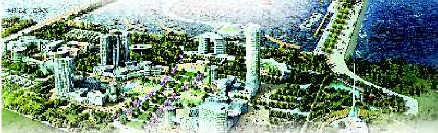
招远市渔港旅游码头鸟瞰效果图。

3月8日上午,招远市渔港旅游码头建设项目正式开工,招远将滨海旅游业作为先导产业,通过做强旅游经济板块,该市正力争在更高层次和更宽领域融入山东半岛蓝色经济区建设。