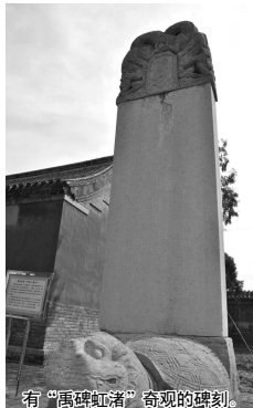
有“禹碑虹渚”奇观的碑刻。

在龙头柏北面,有一棵柏树,仅暴露的树根面积达20多平方米,被当地老百姓称为碾盘柏。树下盘根错节,隆起地面,似圆形的扇面向四周伸展,树根之间又为体态各异的动物,设计了躺卧的地方,就像洞穴一样,似人躺卧的地方叫“人窝”,似各种禽兽躺卧的地方叫“猪窝”、“狗窝”、“鸡窝”、“兔窝”。仔细观察树根的形态,纹理又像各种各样的动物,故当地也称“属相柏”。