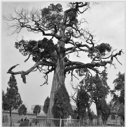
▲胸径达1.52米的柏树。 ▶属相柏号称有十二生肖的洞穴。