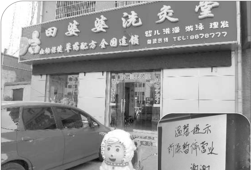
▲“田婆婆洗灸堂”正常营业。

西昌一男孩在“田婆婆洗灸堂”接受4次中药洗浴后,患上了俗称“不死癌症”的脓疱型银屑病,长满脓疱,全身溃烂。2010年3月,当地有关部门调查认定田婆婆洗灸堂所用的产品属无厂址、无厂名、无生产日期和保质期的“三无”产品。3月15日晚,央视2011年3·15晚会曝光了这一事件。3月16日,记者来到位于兰山区妇幼保健院南侧的“田婆婆洗灸堂”加盟店看到,该店除暂停药澡外,其他服务正常进行。