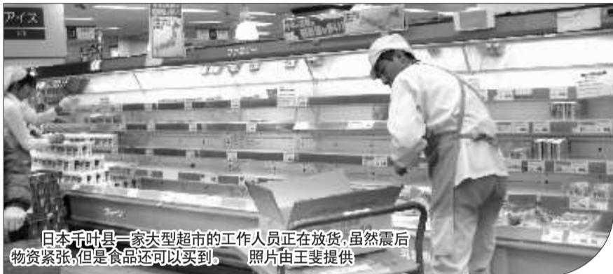
日本千叶县一家大型超市的工作人员正在放货,虽然震后物资紧张,但是食品还可以买到。