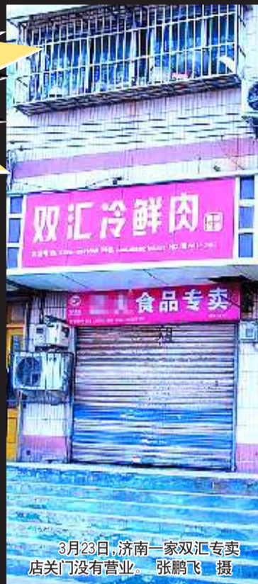
3月23日，济南一家双汇专卖店关门没有营业。