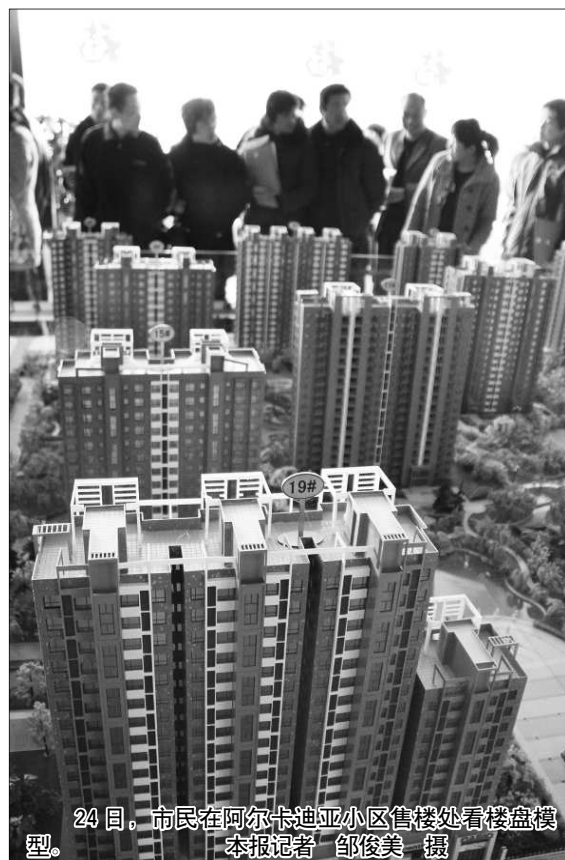
24日,市民在阿尔卡迪亚小区售楼处看楼盘模型。

该科的另一位负责人说,目前聊城正在积极落实全国和省的房价调控政策,稳定聊城的房地产市场。“我们也起草了一个聊城的房地产调控政策,近期有可能会出台。”