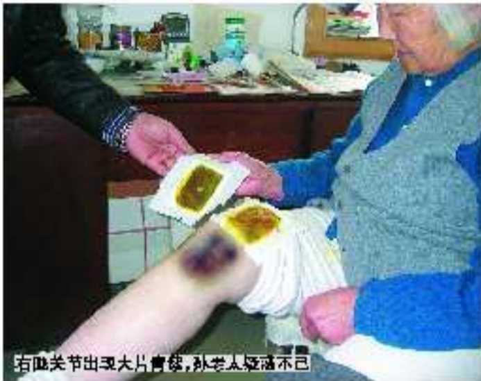
右腿关节出现大片青斑，孙老太惶恐不已

老人的膝关节竟然出现了青紫色的斑块，怎么擦怎么洗都不掉，难道是贴坏了？可老人却很高兴，腿也不疼不肿，反倒很舒服。