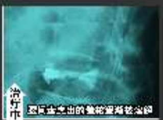
治疗后 突出物突出约0.1厘米