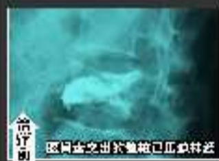
治疗前 突出物突出约1.5厘米