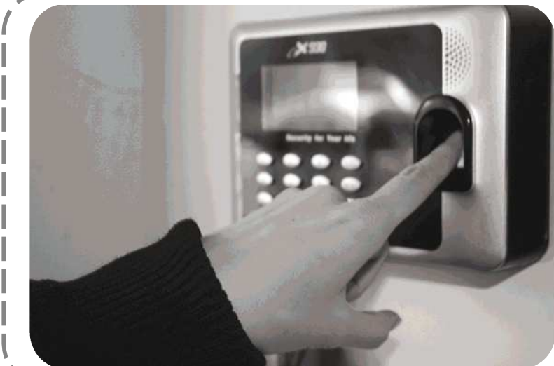
图为一公司员工在进行指纹考勤。

上班、下班都要留指纹,以做出勤记录,时下在岛城部分单位盛行的“指纹打卡”引发争议。员工认为公司强制要求员工留指纹有侵权的嫌疑。法律界人士建议,在遇到这种情况时,员工可以向公司申请签署保密合同。