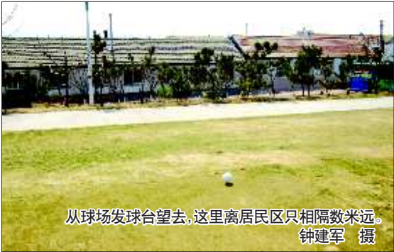
从球场发球台望去,这里离居民区只相隔数米远。

随后,记者来到养马岛东方高尔夫球场办公室,一位工作人员表示,曾有些居民来反映过相关问题,相关领导已外出开会,待相关领导回公司后,一定将这个情况向相关领导汇报,希望得到一个良好的解决方法。 当记者问及,球场有没有专人负责在球场外捡球时,该工作人员表示,由于高尔夫球场外临近居民区,将球打到外面后,一般都被路过的人捡走,派遣专人到场外捡“飞”球有难度。