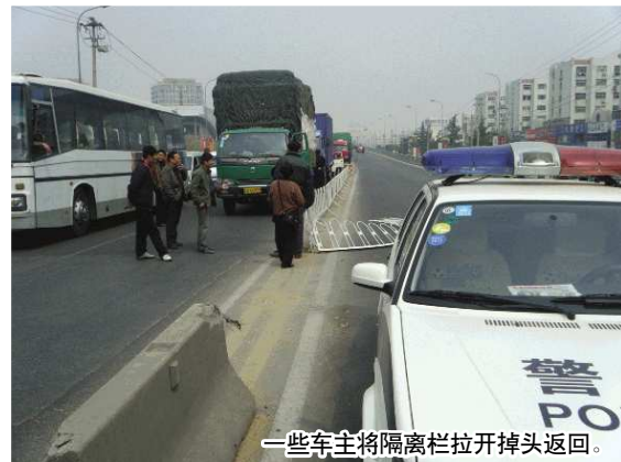
一些车主将隔离栏拉开掉头返回。