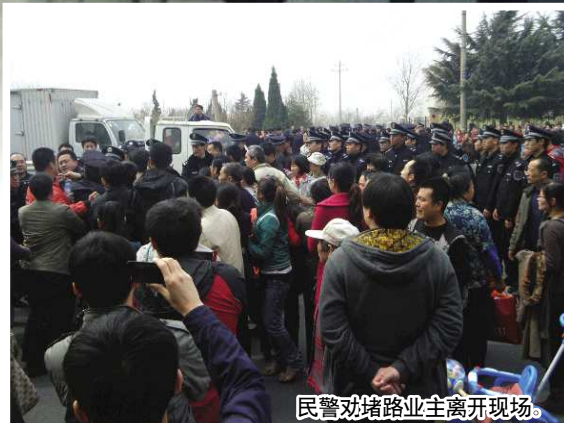
民警劝堵路业主离开现场。

业主们对开发商给出的不承担违约责任的理由十分不满,“我们大多数人的合同都是在2009年签的,当地村民阻挠施工是2008年的事,这怎么能成为延期交房不付违约金的理由?”业主们认为,延期交房并非是开发商所说的原因,而是与其内部管理有关。记者调查了解到,枣山家园5栋楼中2、4、5号楼的施工单位是青岛温泉建设集团有限公司,1、3号楼的施工单位则是山东新城建工股份有限公司(以下简称山东新城)。而后者因拖欠农民工工资,在2009年时就被青岛市建委取消了在青岛承接工程的资格。因枣山家园是该公司被驱逐之前中标的工程,因而可以继续施工。据业主介绍,1、3号楼的工地上经常无人施工,他们猜测这与山东新城主力转移、又拖欠工资招不来建筑工人有关。业主们认为,这才是小区延期交房的真正原因。