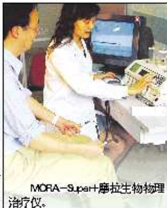
MORA-Super+摩拉生物物理治疗仪。

本科是集医疗、科研、教学于一体的专业特色科室。下设皮肤病、性病门诊、真菌检查室、过敏原检查室、痤疮治疗室、光疗室,开展了中药药浴、中药面膜、脐敷疗法、皮肤划痕疗法、吹烘疗法等本科独具特色的专科疗法20余种。采用传统的中医特色疗法,先进的西医诊断水平,中药内服,外用药浴等标本兼治,对常见的皮肤病如银屑病、白癜风、慢性荨麻疹、成人湿疹、婴幼儿湿疹、痤疮、带状疱疹及后遗神经痛、黄褐斑等的治疗,毒副作用小,治愈率高。采用中西医结合疗法治疗皮肤科危急重症疑难病如重型药疹、系统性红斑狼疮、红皮病、天疱疮、脓疱型银屑病等疗效良好,吸引了不少远道慕名而来的皮肤病患者。本科先后斥巨资引进了世界顶级的过敏性疾病诊断治疗设备MORA-Super+摩拉生物物理治疗仪,可一次性快速检测上千种过敏物质,并可针对检测出的过敏物质进行脱敏治疗,整个检测治疗过程无创伤无痛苦无任何毒副作用,治愈率高。欧美娜蓝光(Omnilux Blue)痤疮治疗仪及红光(Omnilux Revive)动力治疗仪,在物理光治疗痤疮及光动力治疗,美容领域中处于世界先进水平,适用于中、重度(包括囊肿型)痤疮及日常皮肤护理、美容嫩肤、拉紧皮肤、抚平细纹和皱纹的治疗,其中,蓝光治疗炎性痤疮,红光美白嫩肤,祛除黄褐斑。