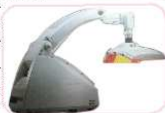
欧美娜红蓝光治疗仪。

地址:迎曙大街216号(电视台东邻)门诊楼二楼皮肤科门诊 咨询电话:0538-6117171