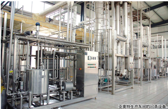
亚奥特生产车间的闪蒸设备

据介绍,山东亚奥特乳业有限公司现经营范围已经涉及到奶牛养殖、乳品研发、加工推广等整个乳业领域,是山东省农业产业化重点龙头企业。目前,公司占地面积 300 亩,职工 950 人,总资产 1.3 亿元,固定资产 9670 万元,银行信用等级 AA 级,拥有固定用户 60 万户,累计上缴税金近亿元。2010 年更是完成销售收入 3.64 亿元,上缴各种税金合计 1040 万元。