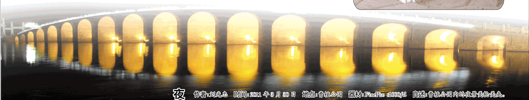
夜 时间:2011年3月30日 地点:曹植公园 器材:FinePix s1000fd 自述:曹植公园内的夜景美轮美奂。