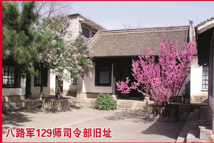
八路军129师司令部旧址

推荐线路: A: 娲皇宫、129师一日游 B: 娲皇宫、129师、五指山二日游 C: 娲皇宫、129师、皇城相府二日游