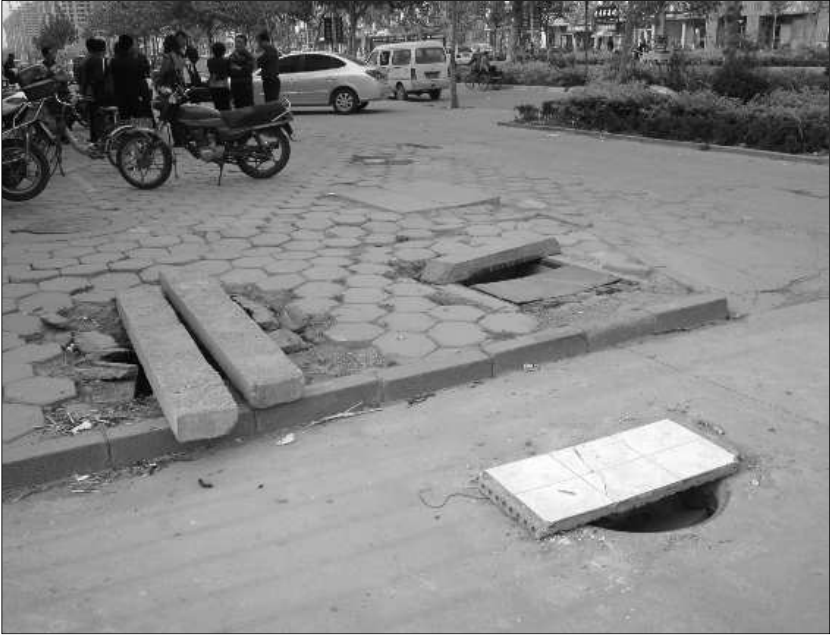
3个井盖丢失,商店老板找来水泥板盖上,防路人掉下。

本报 8451234 热线消息(记者 王尚磊) 东昌府区向阳路一家商店门前,10天丢了3个井盖。店老板说,附近另外一个下水道井盖有明显撬动痕迹,估计也悬了。 3日下午,记者在向阳路路西一家商店门口看到,路面上有3个“洞”,这3个“洞”呈三角形排列,上面都盖着长方形水泥板,每当有汽车靠近时,商店工作人员就跑出来提醒车主注意安全。 商店老板介绍,这3个“洞”上面原本都有井盖,大约10天前,先有一个井盖不翼而飞,后来另外两个也不见了。“这些井盖都是晚上丢的,肯定是被人偷去卖钱了。”商店老板说,这些井盖都是铁的,井盖丢失后,为防止有人路过时掉下去,他专门找来了水泥板,将洞口盖住。 记者看到,这3个“洞”有两个里面安有水管阀门,另外一个为是排污水用的。“还有一个井盖也被撬过,说不定哪天也被偷走了。”商店老板说,在商店北面,一个标有“污水”字样的下水道井盖有明显撬动痕迹。 商店老板说,这些井盖丢失后,既影响生意,也影响路人安全,希望主管部门及时来修理。记者致电聊城市市政公用事业管理局办公室,工作人员表示,将派人检查维修。