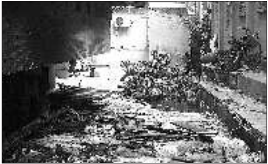
过火后,院内一片狼藉。

本报热线6610123消息(见习记者 李大鹏) 5日下午1:40,上乔东路迎西社区的交通银行家属院内起火,原因正在调查。