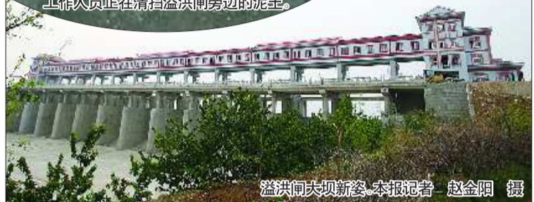
溢洪闸大坝新姿