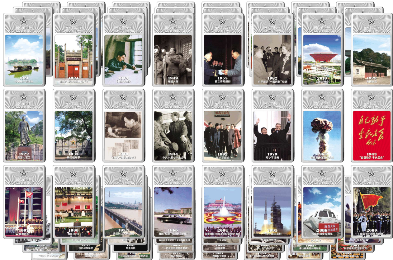
▲大全套共46块纯银砖,一公斤999纯银,双面彩印、双面浮雕,史无前例囊括90个重大历史事件,开创了贵金属收藏的新纪录,规模恢弘,壮丽辉煌,亲临现场,更为震撼!

打破以往“一事一砖”的惯例,精心遴选中国共产党成立90年中的90个重大事件,涵盖政治、经济、军事、科技、文化等方方面面,全方位展示了在中国共产党的领导下,祖国人民万众一心,上下合力,共同取得的卓越成就。“建党90周年纯银砖”以每年一件大事、90年90件大事的丰富内涵,以46块银砖的超大规模,以顶尖的铸造工艺,以一公斤纯银的珍贵材质,开创了自奥运、世博之后的又一个高规格、大主题纪念收藏的新高峰。它主题之大、大事件之多、工艺之精美、收藏空间之大,前所未有的!