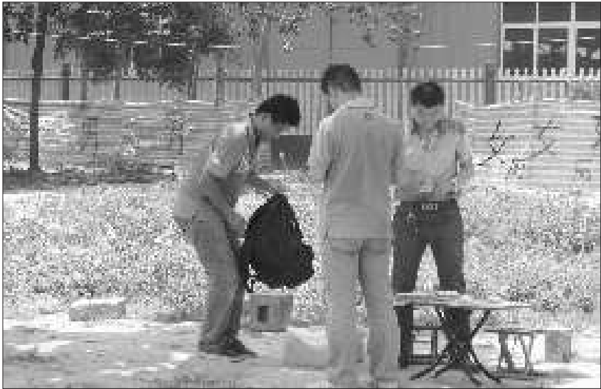
路考等候地点旁，村民围起的简易厕所。