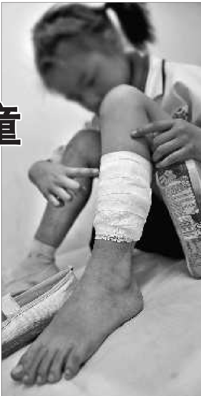
慌乱中,一名七岁小女孩的左腿被大象蹭伤。