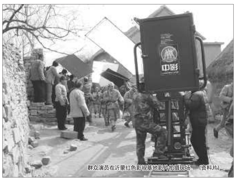
群众演员在沂蒙红色影视基地影片拍摄现场。(资料片)

一座毫不知名的小山村,在被剧组看中并在此拍戏之后,一夜间名闻遐迩。沂南县马牧池乡常山庄经过改造和建设,有了新的名字,就是沂蒙红色影视基地。这只是临沂影视基地发展历程中一个剪影。在这里,我们看到了一个山村的巨变,一群农民的巨变。