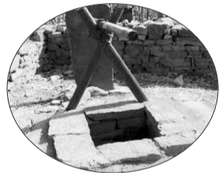
拍摄《沂蒙》时常山庄里又建设了地主大院、炮楼等众多场景,这口老井就是其中之一。

现在的常山庄已经不再是以前那个不起眼的小山村,而是摇身一变成为远近闻名的影视基地。每年,到这里来拍戏或游玩的人可达30多万人。这里的农民也不再是普通的农民,而是经常有走进影视镜头的群众演员,很专业。