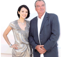
章子怡佩戴TESIRO通灵红毯系列“星夜女神”钻饰,担任新加坡影汇活动大使。

当天活动中,章子怡一身银色礼服,搭配TESIRO通灵红毯系列钻饰“星夜女神”。绚丽的钻石颗颗明晰,宛如点缀