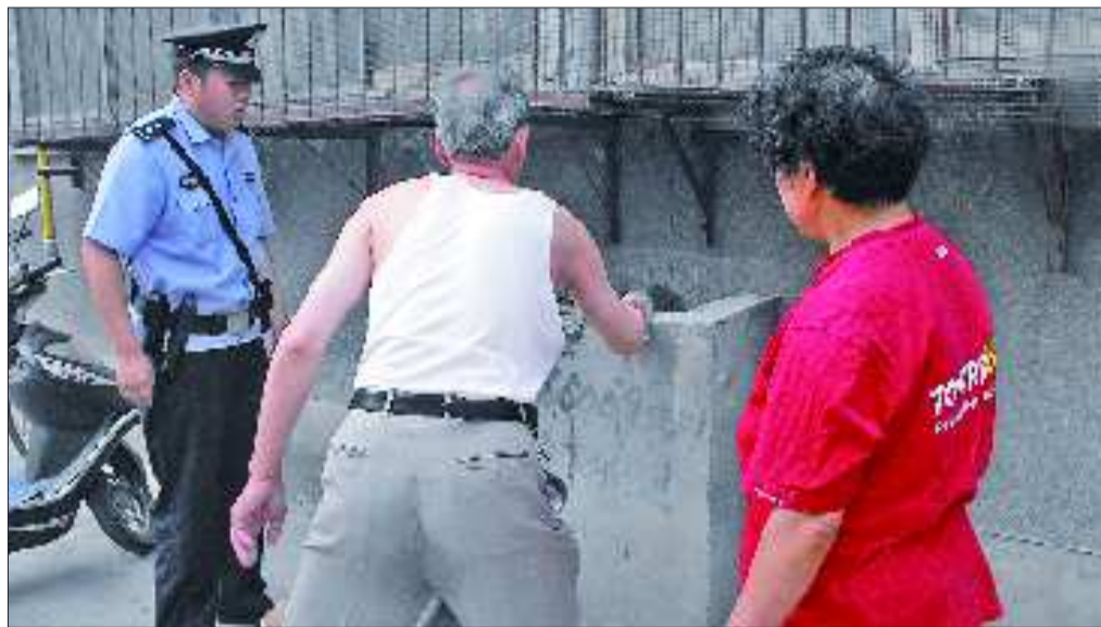
居民和民警费了很大劲也没抓住蛇。

本报6月15日讯(记者 尹明亮) 15日上午,家住历山路55号院的居民们发现,自己小区里来了一位“不速之客”——一条一米多长,直径达五六厘米的大花蛇。为了赶走这位“客人”,小区居民和民警忙活了一上午,可最终还是没能把它抓住。