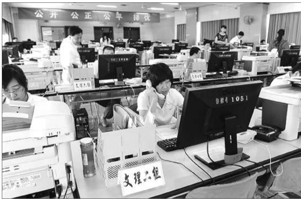
2010年7月的高招录取现场。(资料片)

由于今年我省本科三批合并到本科二批,院校数量增多,本科二批分数线的划定更受考生和家长关注。