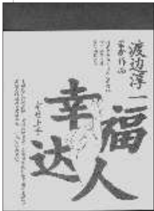
《幸福达人》 [日]渡边淳一 上海译文出版社 2011年5月出版

换言之,此书更像一个简易的隧道,带你迅速穿越漫长人生,并告诉你如何以最便捷的方式直抵幸福,省略不必要的苦恼。真的,有时候人生这么短,不必活得太复杂。