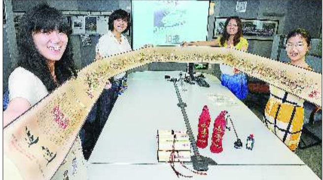
5米长卷让人耳目一新。

原始画面由本报视觉工作室根据京沪高铁沿线各地实景以精致的工笔手法,历时两月有余手绘而成。长卷整体构图疏密得当,注重节奏感和韵律的变化,色彩淡雅,笔墨章法巧妙,具有浓郁的中国画风格,可谓京沪高铁版的“清明上河图”。打开这幅5米长卷,便可以对京沪高铁全部24个站点和所有沿线风光有一个整体的认识,使人在领略京沪高铁蜿蜒千里雄姿的同时,感受到强烈的视觉冲击。 “京沪高铁全景珍藏长卷”共制作200卷,每卷均有唯一的编号。其中,“001号”长卷已被山东博物馆收藏。