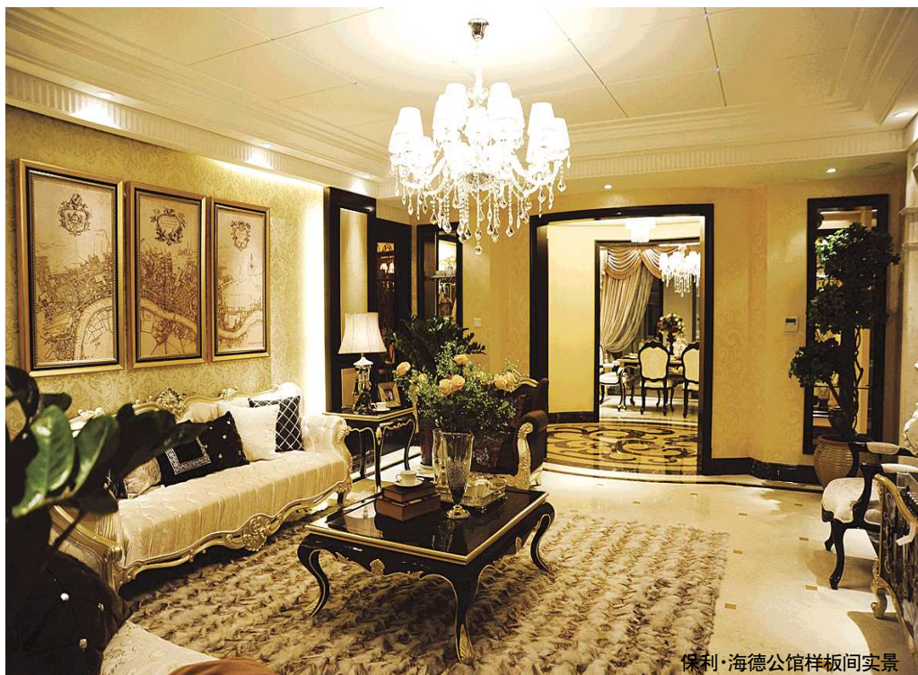
保利·海德公馆样板间实景

工作人员还让我用手摸样板间的石材拼花，完全感觉不到有拼缝的感觉。工作人员说，这是采用的高压水流切割工艺，保