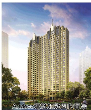
Art Deco建筑如凝固的音乐

建筑是凝固的音乐，会所的石材外立面，足已让我感受到了这一传承百年的Art Deco的贵族气质。100多年来，作为城市文明进程中唯一被传世的经典符号，Art Deco被赋予贵族的气质，彰显出了高端阶层所追求的高贵感。