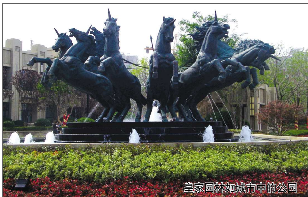
皇家园林如城市中的公园

目园林负责人说了三点。第一点海德公馆的园林规划理念来自英国皇家公园——海德公园，负责人及设计师数次前往海德公园汲取精粹，最终营造出纯粹的台地园林仪式感。