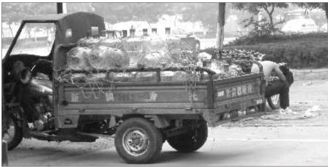
一家纯净水代售点门前一车纯净水,里面已经没有PET桶。

本报6月27日讯(记者崔洪英)“这种桶不能用了,需要再花30元买个这样的桶。”6月26日,方先生去桶装纯净水销售点换水的时候被告知,他一直用的PET桶已经“过时”,要换成食用级PC桶,淘汰下来的桶就不退了。方先生不解,桶是交了10元押金的,现在因为不合格要换掉,为什么要消费者埋单?