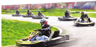
◀景区内新鲜刺激的卡丁车赛场。(资料片)