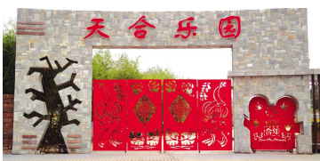
►花样年华景区里的天合乐园景点。(资料片)