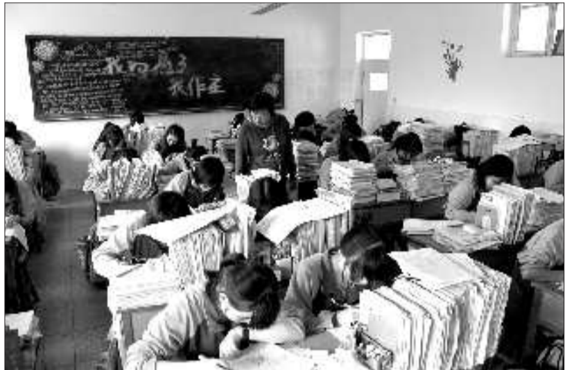
题海“漫步”的高考生。(资料片)

为一探究究竟,连日来本报记者到各相关部门、机构深入采访,为广大读者找寻公办教育资源淡出对复读班的一些影响。