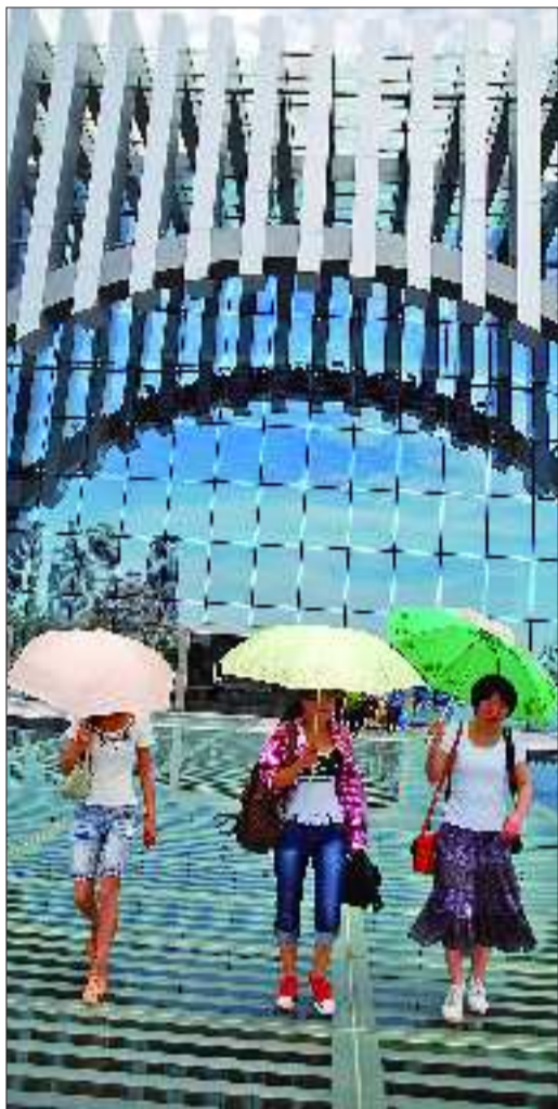
▲新建成的日照市城市规划展览馆在各种设备调试完毕后,将免费对外开放。

本报7月4日讯(记者 贺超) 4日,记者从日照市住建委获悉,日照市城市规划展览馆已全部竣工,目前正在进行灯光调试和馆内布展工作,待全部完成以后,便可以对外开放,届时观众可以领略到日照独特的城市魅力,并能够体验互动项目。