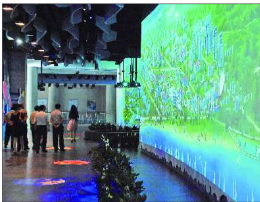
▲动画展墙将向市民展现日照的城市新风貌。

相对而言,三楼的互动设施要比二楼多一些。在正对自动扶梯的对面,先后设置有动感踩吧,未来建筑师和海洋家园等互动设施。动感踩吧的屏幕设置在地板上,背景为一个水塘,里面有许多游动的鱼,当脚踩到屏幕上,会产生一个鱼的涟漪,鱼也会快速地游走。