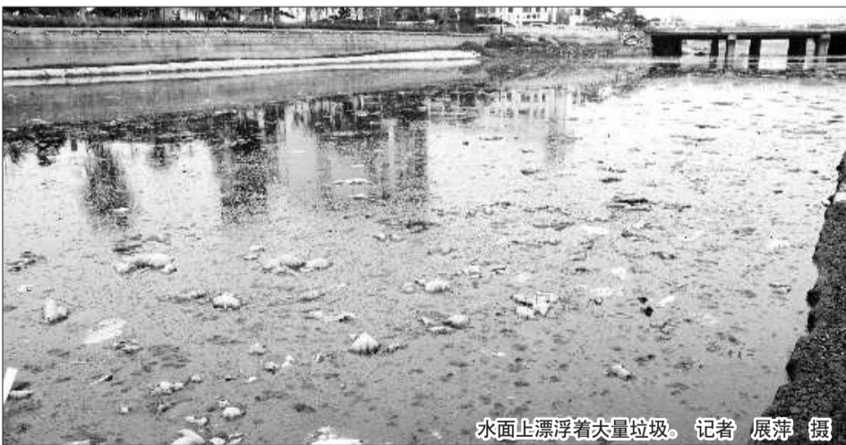
水面上漂浮着大量垃圾。

年通过治理已经变清了，周围还进行了绿化，市民都很希望绿色的生态环境能够保持下去。可是，怎么一夜之间，陷泥河又变脏变臭了呢？