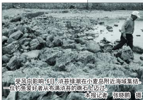
受风向影响,6日,浒苔绿潮在小麦岛附近海域集结,一位钓鱼爱好者从布满浒苔的礁石上迈过。