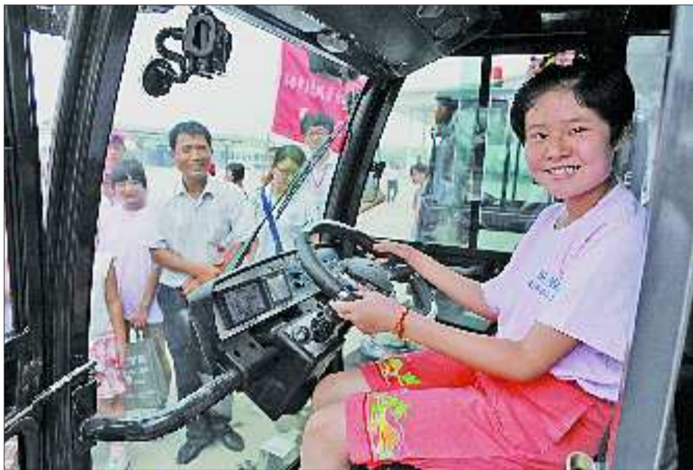
▲要是我爸妈用这个扫地多带劲。在济南西站,孩子们参观现代化的自动清扫机。本报记者 周青先 摄

本报7月21日讯 21日上午,由本报联合济南市城管局,市城管执法局主办的“酷暑送清凉——关爱城管保洁员子女夏令营”举行第二次活动,40名小营员聆听了名师讲授如何感恩之后,一起来到济南西站参观,感受现代化车站带来的方便和震撼。上午9点钟,40名孩子走进课堂,来自山东省心理咨询中心的心理学教授张洪涛为各位小营员讲述了在现实生活中怎样励志和如何感恩,40分钟的时间不知不觉过去,不少小营员还意犹未尽,舍不得下课。特色课结束后,40名小营员乘坐