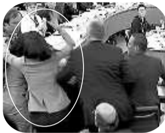
网上恶搞邓文迪的图配文。

7月19日，传媒大亨默多克出席听证会时遭人意外袭击，妻子邓文迪第一时间站起来阻止袭击者，英国媒体形容邓文迪的这一下意识反应“犹如老虎般迅猛”，邓文迪因此也获得了“虎妻”这一称号。