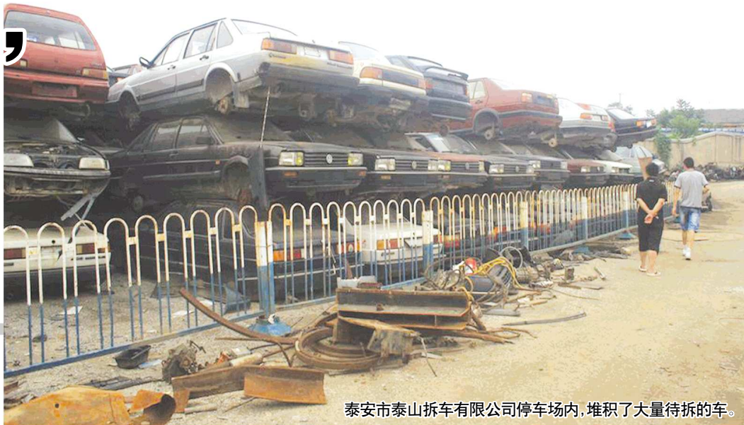
泰安市泰山拆车有限公司停车场内，堆积了大量待拆的车。

交警部门在查车时，有时候会发现行驶在道路上的无手续、无保险的报废车辆。既然车辆报废了，为何还能在路上行驶？记者调查发现，当车辆达到报废年限时，交警部门将车列为报废车甚至强制注销，但有时难以掌握这些车的动态，无法采取有效措施进行处理，从而导致部分报废车开上了路。