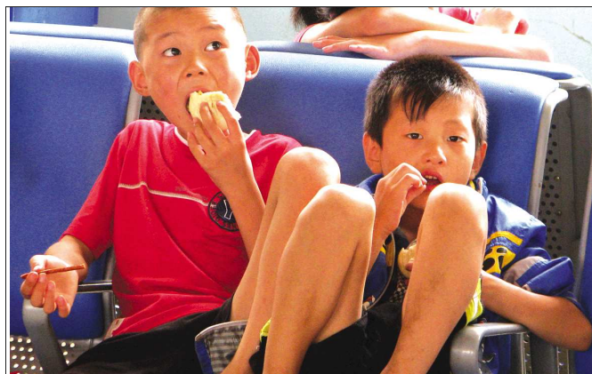
◀两个孩子火车站候车室内一边吃包子一边看电影。