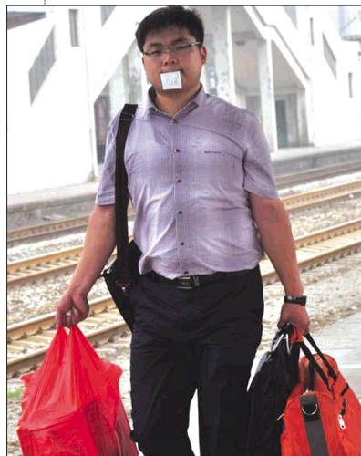
▼一位旅客双手提着行李,只好把车票含在嘴里。