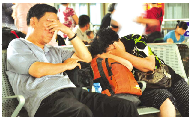
▶几位旅客在等车时睡着了。