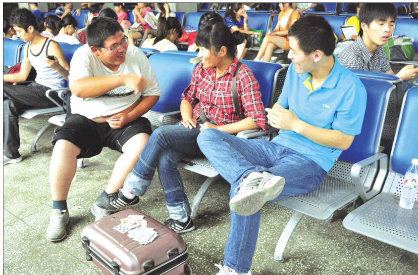
▲到滕州的三位旅客在候车室玩扑克。