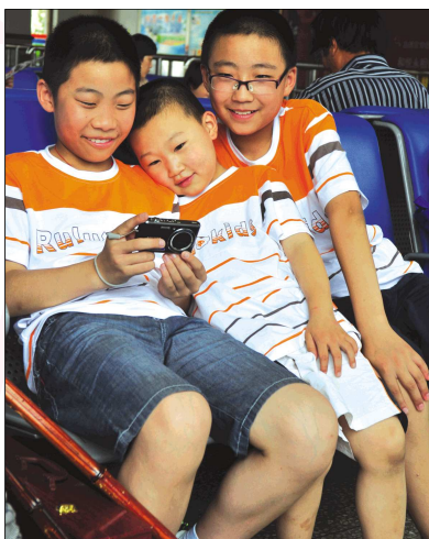
▲三位小旅客正嬉笑着看着相机中的照片。

火车站、汽车站、高铁站迎来客流高峰,游客、学生、务工人员成为这次暑运大军的主角。在车站,乘客们有的摆弄着爬山的拐棍,有的戴着特色的遮阳帽,还有的在玩扑克、拍照、听歌、吃饭、嬉闹……每个人的脸上都挂着不同的表情。