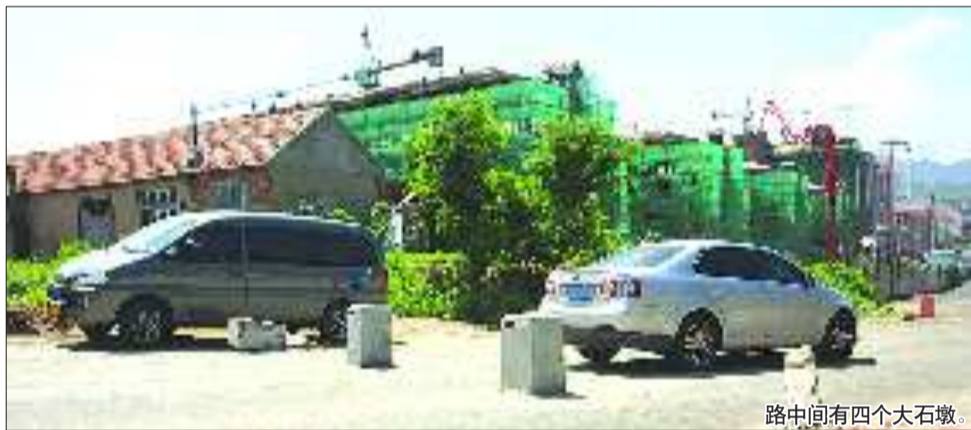
路中间有四个大石墩。

从石墩中间过道穿行的车辆都要减速慢行,车身险险滑过石墩,不到15分钟的时间,就有8辆车因车速压得太慢而熄火。