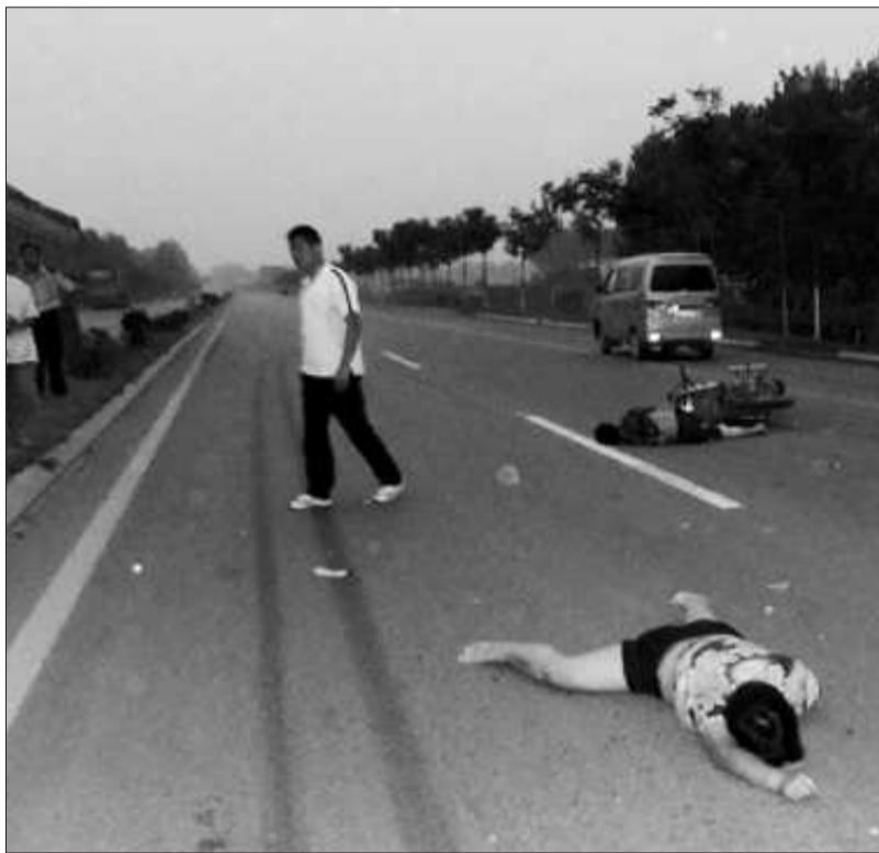
▲第二起车祸的事发现场。

短短1小时内,菏泽一农村家庭接连遭到两场车祸打击。一位年轻的母亲带着两个孩子被一辆拖拉机撞伤后,闻讯来的父亲和奶奶在距离事故现场100多米远的地方,又被一辆面包车撞伤。两起事故致使这个家庭5人受伤,其中2人伤势较重。