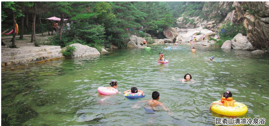
昆崙山清凉冷泉浴

那如梦似幻的狄芦风雪。那真山、真水、真自然的生态美一定会带给你们感动，带上你的爱人一起来这里吧，在感动中升华真爱，在宁静中感悟人生。沿途，可观龙王庙、仙女抚琴等景点，亦可游览古木瓜、雷音潭、翡翠壁，情人谷，观赏藏经阁、仙人台、观音峰……总有一种美丽是你要寻找的，也总有一种默契是你们一直在默默等待的。“山无棱，江水为竭，冬雷震震，夏雨雪，天地合，乃敢与君绝”，山是充满灵性的，带上爱的誓言，让山作证，让爱永恒。